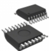
MIC2583-MYQS-TR Microchip Technology IC CTRLR HOT SWAP 200MV 16-QSOP