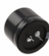
ECO-S2DP821EA Panasonic Electronic Components CAP ALUM 820UF 20% 200V SNAP