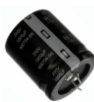
ECO-S2EB102EA Panasonic Electronic Components CAP ALUM 1000UF 20% 250V SNAP