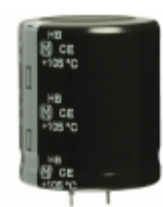
ECO-S2EB122EA Panasonic Electronic Components CAP ALUM 1200UF 20% 250V SNAP