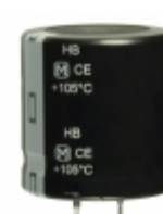
ECO-S2EB471DA Panasonic Electronic Components CAP ALUM 470UF 20% 250V SNAP