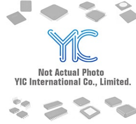
MC78M15CDRKG ON ON T0252