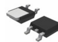
MC78M15CDTRKG ON Semiconductor IC REG LDO 15V 0.5A DPAK