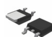
MC78M15CDTG ON Semiconductor IC REG LDO 15V 0.5A DPAK