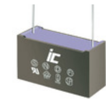
MPX474K305G Illinois Capacitor CAP FILM 0.47UF 10% 305VAC RAD