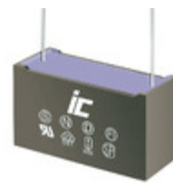
MPX475K305N Illinois Capacitor CAP FILM 4.7UF 10% 305VAC RAD