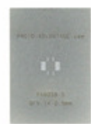
PA0059-S Chip Quik, Inc. QFN-14 STENCIL