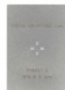
PA0057-S Chip Quik, Inc. QFN-8 STENCIL