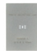
PA0058-S Chip Quik, Inc. QFN-8 STENCIL