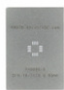
PA0060-S Chip Quik, Inc. QFN-16-THIN STENCIL