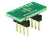
PA0058 Chip Quik, Inc. QFN-8 TO DIP-8 SMT ADAPTER