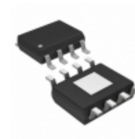
MIC37301-1.8YME-TR Microchip Technology IC REG LDO 1.8V 3A 8SOIC