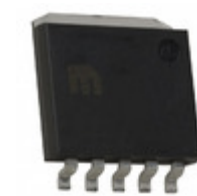
MIC37301-2.5BR Microchip Technology IC REG LDO 2.5V 3A SPAK-5