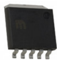
MIC37301-1.8BR Microchip Technology IC REG LDO 1.8V 3A SPAK-5