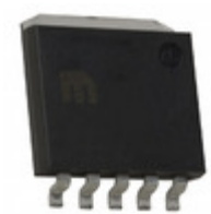
MIC37301-1.65BR TR Microchip Technology IC REG LDO 1.65V 3A SPAK-5