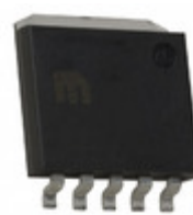
MIC37301-1.65BR Microchip Technology IC REG LDO 1.65V 3A SPAK-5