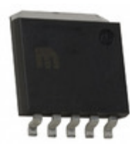
MIC37301-1.8WR Microchip Technology IC REG LDO 1.8V 3A SPAK-5