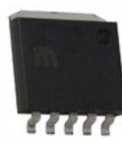
MIC37301-1.8BR TR Microchip Technology IC REG LDO 1.8V 3A SPAK-5