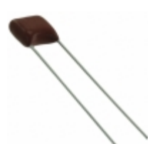
ECQ-E2123JB Panasonic Electronic Components CAP FILM 0.012UF 5% 250VDC RAD