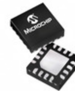
PIC16F15325-E/JQ Microchip Technology IC MCU 8-BIT 14KB FLASH 16UQFN