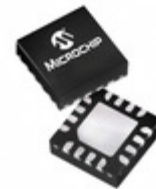
PIC16F15324T-I/JQ Microchip Technology IC MCU 8BIT 7KB FLASH 16UQFN