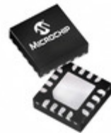
PIC16F15324-I/JQ Microchip Technology IC MCU 8BIT 7KB FLASH 16UQFN