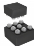
SST26WF016B-104I/CS Microchip Technology IC FLASH 16MBIT 104MHZ 8CSP