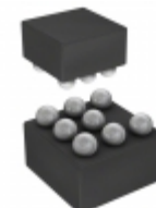
SST26WF016BA-104I/CS Microchip Technology IC FLASH 16MBIT 104MHZ 8CSP