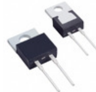
SBL550 Diodes Incorporated DIODE SCHOTTKY 50V 5A TO220AC