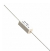
SBL5R015J TE Connectivity Passive Product RES 0.015 OHM 5W 5% AXIAL