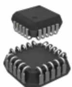
MIC5842BV Microchip Technology IC DRVR LATCH 8BIT SER IN 20PLCC