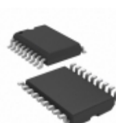
MIC5842BWMTR Microchip Technology IC DRVR LATCH 8BIT SER IN 18SOIC