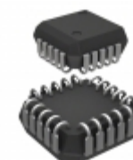
MIC5841YV-TR Microchip Technology IC DRVR LATCH 8BIT SER IN 20PLCC