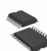
MIC5841YWM Microchip Technology IC DRVR LATCH 8BIT SER IN 18SOIC