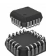
MIC5842BV-TR Microchip Technology IC DRVR LATCH 8BIT SER IN 20PLCC