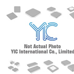
IRF7726PBF IOR IRF7726PBF IOR