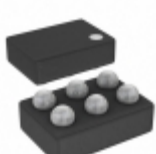
ADP221ACBZ2828-R7 Analog Devices Inc. IC REG LDO 2.8V 0.2A 6WLCSP