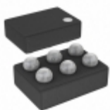
ADP220ACBZ-2812R7 Analog Devices Inc. IC REG LDO 2.8V/1.2V 0.2A 6WLCSP