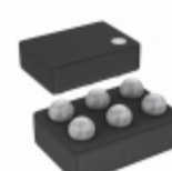
ADP220ACBZ-2827R7 Analog Devices Inc. IC REG LDO 2.8V/2.7V 0.2A 6WLCSP