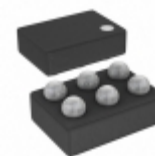
ADP220ACBZ-2828R7 Analog Devices Inc. IC REG LDO 2.8V 0.2A 6WLCSP