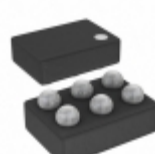
ADP220ACBZ-3033R7 Analog Devices Inc. IC REG LDO 3V/3.3V 0.2A 6WLCSP