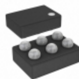
ADP221ACBZ-1818-R7 Analog Devices Inc. IC REG LDO 1.8V 0.2A 6WLCSP