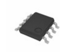
BR93G86FJ-3AGTE2 LAPIS Semiconductor MICROWIRE BUS 16KBIT(1024X16BIT)