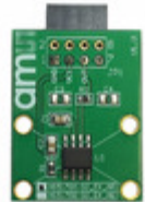
AS5170A-SO_EK_AB ams EVAL BOARD FOR AS5170A