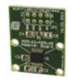
AS5165 AB ams ADAPTER BOARD FOR AS5165