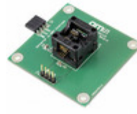
AS516X-SO_EK_SB ams SOCKET BOARD FOR AS5161/62