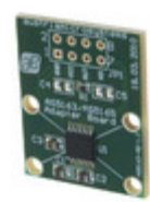
AS5163-TS_EK_AB ams BOARD ADAPTER AS5163