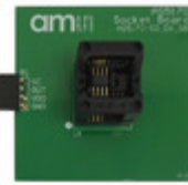
AS5170-SO_EK_SB ams SOCKET BOARD FOR AS5170