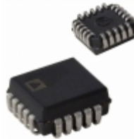
ADG201HSPKZ-REEL Analog Devices Inc. IC SWITCH QUAD SPST 20PLCC