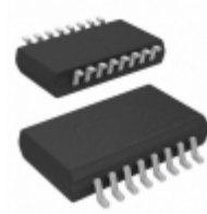
ADG201HSKR Analog Devices Inc. IC SWITCH QUAD SPST 16SOIC