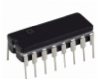
ADG202ABQ Analog Devices Inc. IC SWITCH QUAD SPST 16CDIP