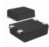
S-1009C32I-I4T1U SII Semiconductor Corporation IC VOLT DETECTOR