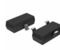
BZX84B3V3-HE3-18 Electro-Films (EFI) / Vishay DIODE ZENER 3.3V 300MW SOT23-3