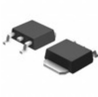
BD50C0AFP-CE2 LAPIS Semiconductor IC REG LINEAR 5V 1A TO252-3