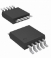
MIC5254-SJBMM-TR Microchip Technology IC REG LDO 3.3V/2.5V 10MSOP