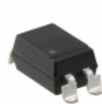
PS2505L-1-E3-A CEL OPTOISOLATOR 5KV TRANS 4SMD