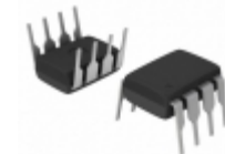
PS2505-2X Isocom Components 2004 LTD OPTOISO 5.3KV 2CH TRANS 8DIP