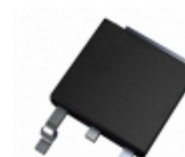
IXCY02M45A IXYS IC CURRENT REGULATOR DPAK