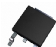
IXCY02M35 IXYS IC CURRENT REGULATOR DPAK