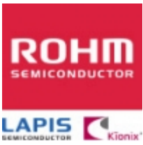
BD4935FVE ROHM BD4935FVE ROHM