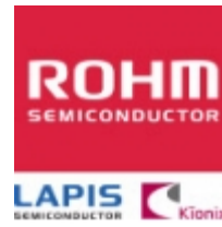
BD4933FVE ROHM BD4933FVE ROHM