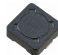
DR73-680-R Bussmann (Eaton) FIXED IND 68UH 890MA 358 MOHM