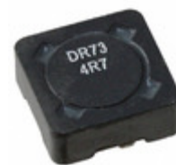
DR73-4R7-R Bussmann (Eaton) FIXED IND 4.7UH 3.09A 29.7 MOHM