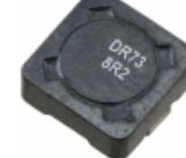
DR73-8R2-R Bussmann (Eaton) FIXED IND 8.2UH 2.19A 59.2 MOHM