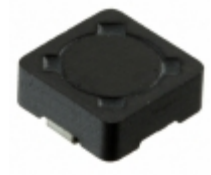
DR73-820-R Bussmann (Eaton) FIXED IND 82UH 860MA 384 MOHM