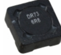
DR73-6R8-R Bussmann (Eaton) FIXED IND 6.8UH 2.55A 43.5 MOHM