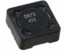
DR73-470-R Bussmann (Eaton) FIXED IND 47UH 1.08A 241 MOHM