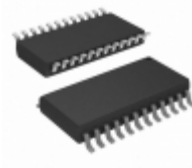
ICL3217ECB Intersil IC TXRX RS-232 3-5.5V ESD 24SOIC