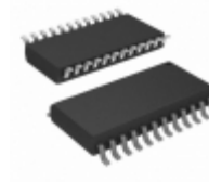
ICL3217EIB Intersil IC TXRX RS-232 3-5.5V ESD 24SOIC