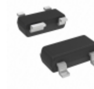
TC1271ASVRCTR Microchip Technology IC RESET MONITOR 2.93V SOT143-4