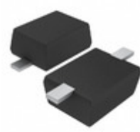
UDZVTE-172.7B Rohm Semiconductor DIODE ZENER 2.7V 200MW UMD2