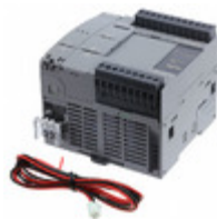
FC6A-C16P1CE IDEC 16IO CPU 24VDC TRANS. SOURCE