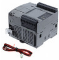
FC6A-C16K1CE IDEC 16IO CPU 24VDC TRANS. SINK