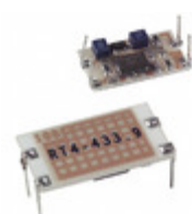
AMRT4-433 RF Solutions TRANSMITTER AM HYBRID 433MHZ