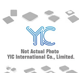
AMR434N-T1-PF AnalogPow AnalogPow DFN56