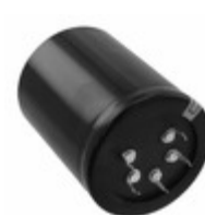
ECE-P2DA472HX Panasonic Electronic Components CAP ALUM 4700UF 20% 200V SNAP