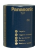
ECE-P2AP153HA Panasonic Electronic Components CAP ALUM 15000UF 20% 100V SNAP