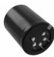
ECE-P2DA332HA Panasonic Electronic Components CAP ALUM 3300UF 20% 200V SNAP