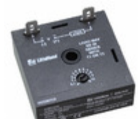
KSD1230 Hamlin / Littelfuse RELAY TIME DELAY 10SEC CHASSIS