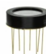
SD444-42-22-261 Luna Optoelectronics DETECTOR/AMP BLU 11.3MM DIA