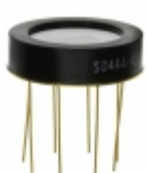
SD444-43-23-262 Luna Optoelectronics DETECTOR/AMP UV 11.3MM DIA