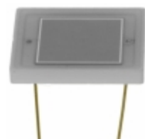
SD445-11-21-305 Luna Optoelectronics PHOTODIODE GP CERM PKG