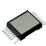
IXRFSM12N100 IXYS RF 2A 1000V MOSFET IN SMPD PACKAGE