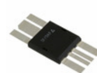
IXRFD630 IXYS RF IC MOSFET DVR RF 30A HI DCB