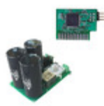
IXRD1002 Zilog EVAL BRD INRUSH CURRENT CONTROL