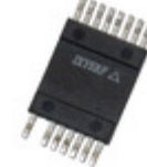
IXRFD631 IXYS IC MOSFET DVR RF 30A LOW DCB