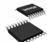
X9421YS16-2.7T1 Intersil IC XDCP SGL 64-TAP 2.5K 16-SOIC