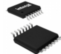
X9421WV14Z Intersil IC XDCP SGL 64-TAP 10K 14-TSSOP