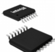
X9421WV14Z-2.7T1 Intersil IC XDCP SGL 64-TAP 10K 14-TSSOP