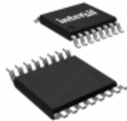
X9421YS16-2.7 Intersil IC XDCP SGL 64-TAP 2.5K 16-SOIC