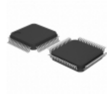
ATSAM4SA16BB-AN Micrel / Microchip Technology FLASH,160K SRAM