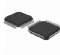
ATSAM4SA16BB-AN Micrel / Microchip Technology FLASH,160K SRAM