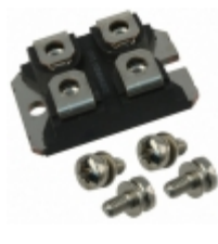
IXSN80N60BD1 IXYS IGBT 600V SCSOA SOT-227B