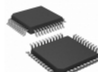
TS87C51RD2-LIE Microchip Technology IC MCU 8BIT 64KB OTP 44VQFP