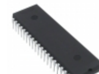
TS87C51RD2-MIA Microchip Technology IC MCU 8BIT 64KB OTP 40PDIL