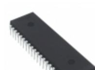
TS87C51RD2-LIA Microchip Technology IC MCU 8BIT 64KB OTP 40PDIL