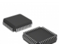
TS87C51RD2-MIB Microchip Technology IC MCU 8BIT 64KB OTP 44PLCC