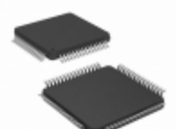
TS87C51RD2-MCM Microchip Technology IC MCU 8BIT 64KB OTP 64LQFP