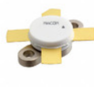
MRF454 M/A-Com Technology Solutions TRANS RF NPN 25V 20A 211-11