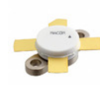
MRF448 M/A-Com Technology Solutions TRANS RF NPN 50V 16A 211-11