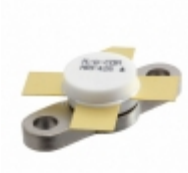
MRF455 M/A-Com Technology Solutions TRANS RF NPN 18V 15A 211-07