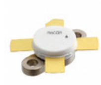
MRF428 M/A-Com Technology Solutions TRANS RF NPN 55V 20A 211-11