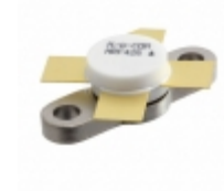
MRF426 M/A-Com Technology Solutions TRANS RF NPN 35V 3A 211-07