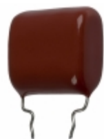
ECQ-P1H224GZW Panasonic Electronic Components CAP FILM 0.22UF 2% 50VDC RADIAL