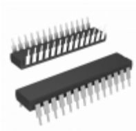
PIC18LF25K83-I/SP Micrel / Microchip Technology FLASH