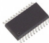
MAX162ACWG Maxim Integrated IC ADC HS LP 12-BIT CMOS 24-SOIC