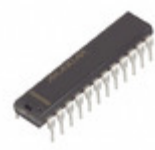
MAX162ACNG+ Maxim Integrated IC ADC 12BIT 3US H-SPEED 24-DIP