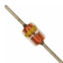
MTZJT-7227C Rohm Semiconductor DIODE ZENER 27V 500MW DO34