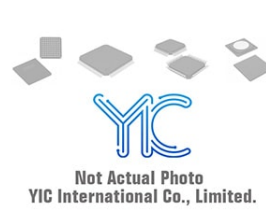
MTZJT-723.9B , SM15T150A ROHM/ST MTZJT-723.9B , SM15T150A ROHM/ST