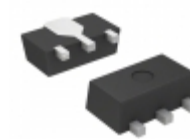
S-80857CLUA-B7IT2G SII Semiconductor Corporation IC VOLT DETECTOR 5.7V SOT89-3