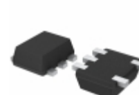
BD5326FVE-TR Rohm Semiconductor IC DETECTOR VOLT 2.6V CMOS 5VSOF