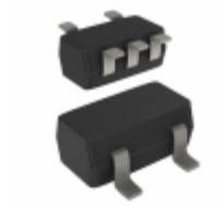
74AHCT1G86GW,125 Nexperia USA Inc. IC GATE XOR 1CH 2-INP 5-TSSOP