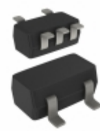
74AHCT1G86GW-Q100 , Nexperia USA Inc. IC GATE XOR 1CH 2-INP 5-TSSOP