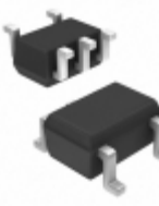
74AHCT1G86SE-7 Diodes Incorporated IC GATE XOR 1CH 2-INP SOT-353