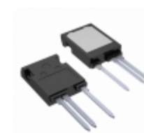
IXYX40N250CHV IXYS Corporation IGBT 2.5KV 70A TO247HV