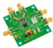
ADL5357-EVALZ Analog Devices Inc. EVAL BOARD FOR ADL5357