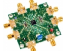
ADL5356-EVALZ Analog Devices Inc. EVAL BOARD FOR ADL5356