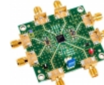
ADL5354-EVALZ Analog Devices Inc. EVAL BOARD FOR ADL5354