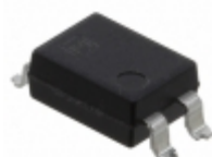
APT1231A Panasonic PHOTOTRIAC COUPLER 600V 4DIP