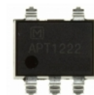
APT1222A Panasonic Electric Works OPTOISOLATOR 5KV TRIAC 6SMD