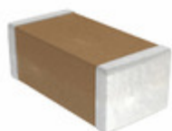
GRM31A7U2E472JW31D Murata Electronics North America CAP CER 4700PF 250V U2J 1206