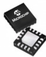
PIC16LF1454-E/JQ Microchip Technology IC MCU 8BIT 14KB FLASH 16UQFN